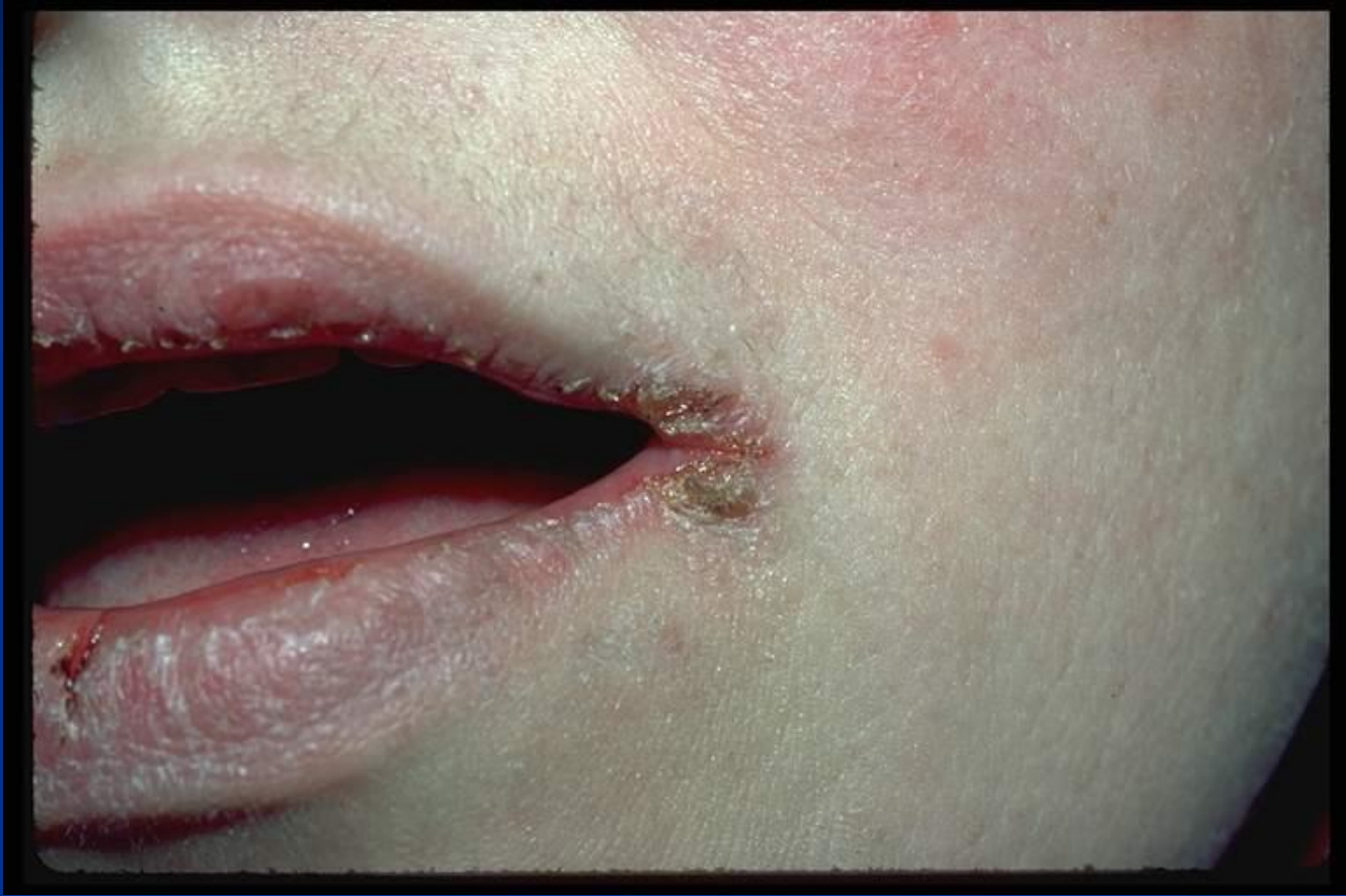
PERLECHE' (CHEILITE ANGOLARE)