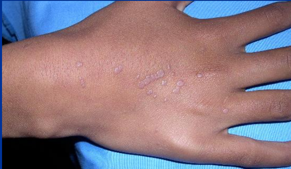
Verruche piane: papule piane al volto e dorso delle mani